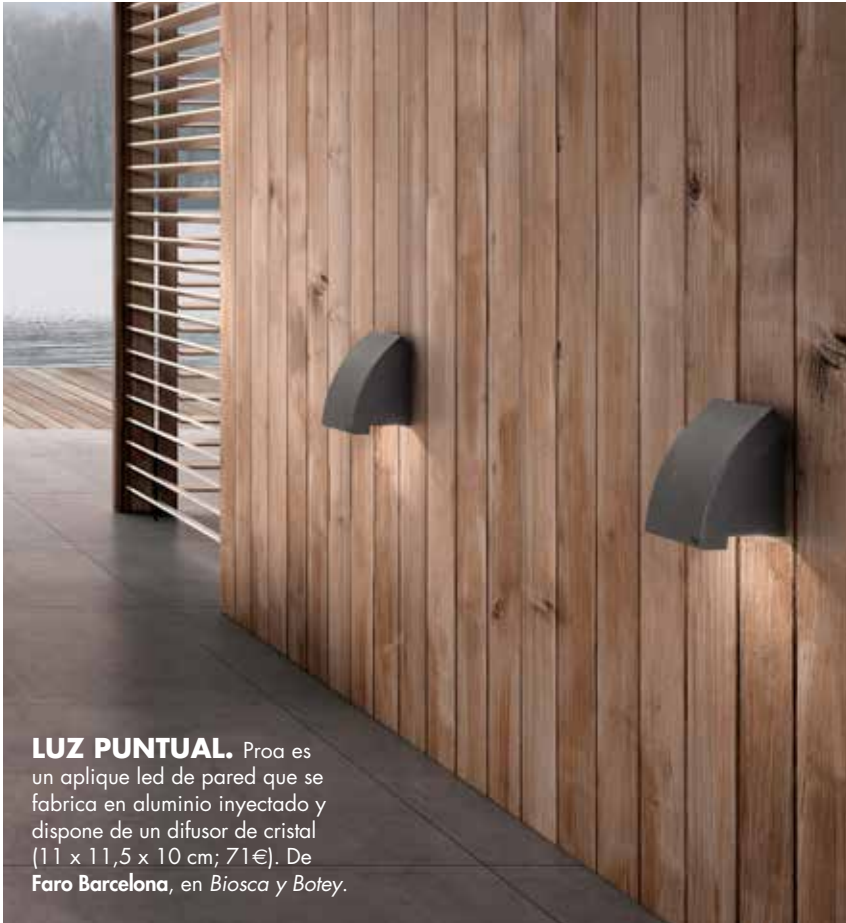
LUZ PUNTUAL. Proa es un aplique led de pared que se fabrica en aluminio inyectado y dispone de un difusor de cristal (11 x 11,5 x 10 cm; 71€). De Faro Barcelona, en Biosca y Botey.