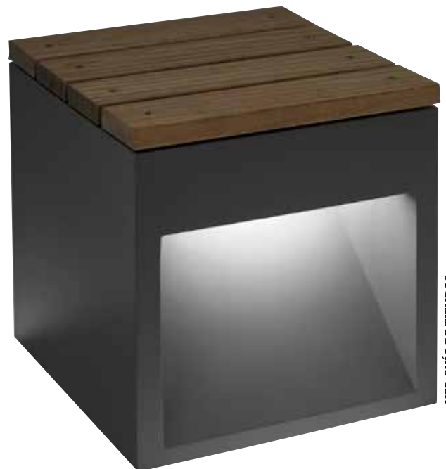
BANCO CON LUZ. La luminaria Lap Bench es un diseño de David Abad para B.Lux. Se trata de un banco con iluminación en ambos lados. Está disponible en dos medidas y con lámparas led y fluorescentes (desde 1.325€).

Ideales para el jardín, los focos de suelo son una buena opción para iluminar el camino de acceso a la vivienda, focalizar la atención en un elemento del paisaje o una escultura. Estos dos son el modelo Tactic (el blanco) y el Logic R A (oscuro), ambos de la colección Wallwash, de Deltalight, en aluminio anodizado (desde 228€).