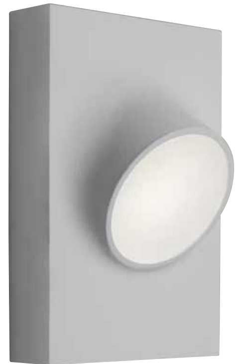
FOCO DE ATENCIÓN. Cíclope (17 x 27 cm; 363€) es una potente fuente lumínica realizada en aluminio con dos acabados en blanco o marrón óxido. Funciona con luz led y es un diseño que firma Artemide.

“La iluminación puntual permite llamar la atención sobre un elemento, pero sobre todo es una herramienta que aporta seguridad, ya que se usa como una baliza que señala un camino”